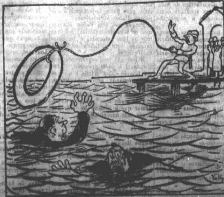
— Se não fosse a benemerita policia aquelles pobres padres...